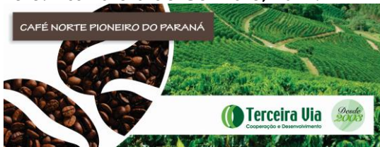
Foto: Logo Café Norte Pioneiro do Paraná.